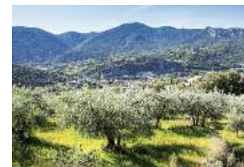
En haut © Paul Villecourt. Ci-dessus © Walk inn Provence.