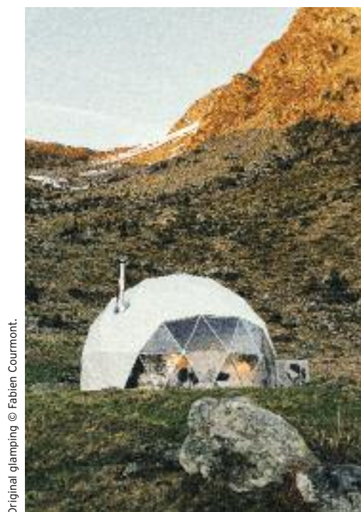
Original glamping © Fabien Courmont.